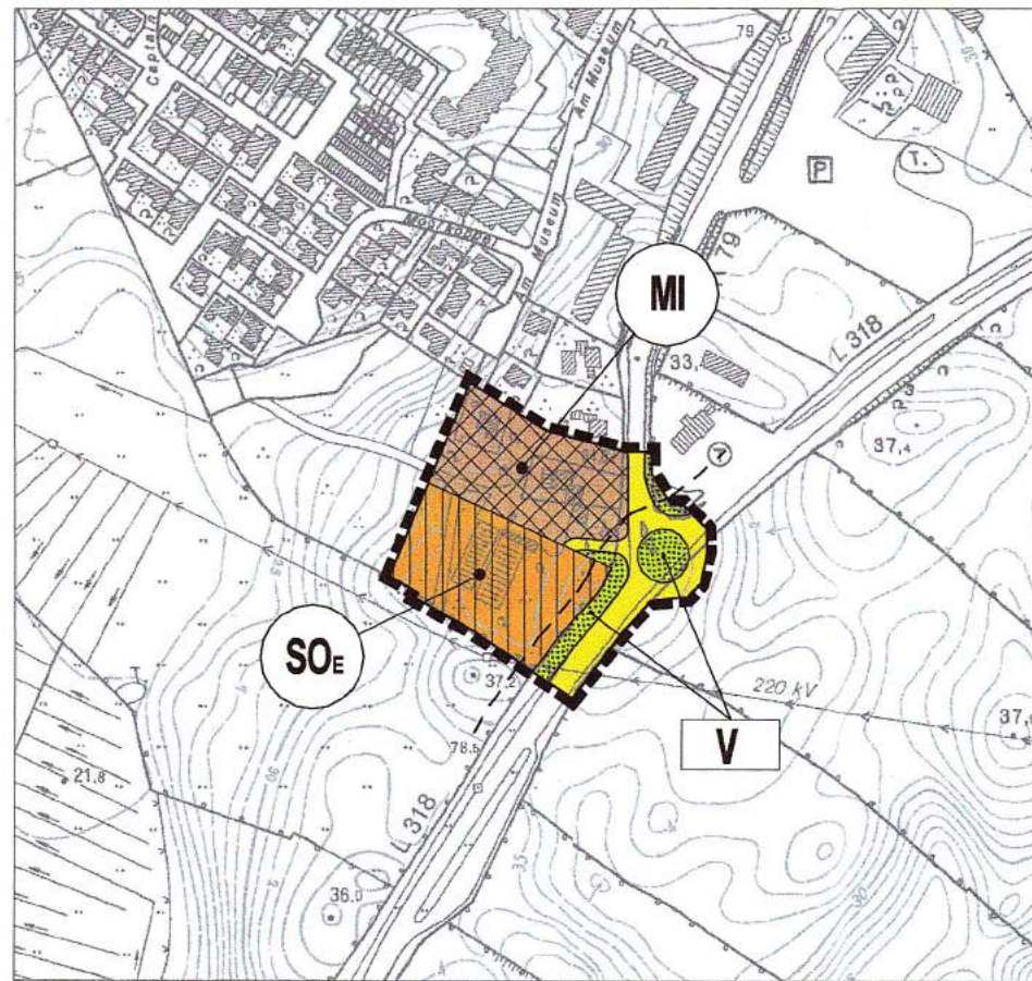
DARSTELLUNG DER 1.ÄNDERUNG DES F-PLANES