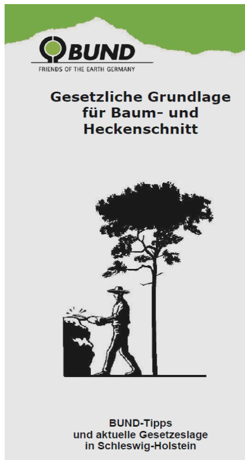
Flyer über die gesetzlichen Grundlagen