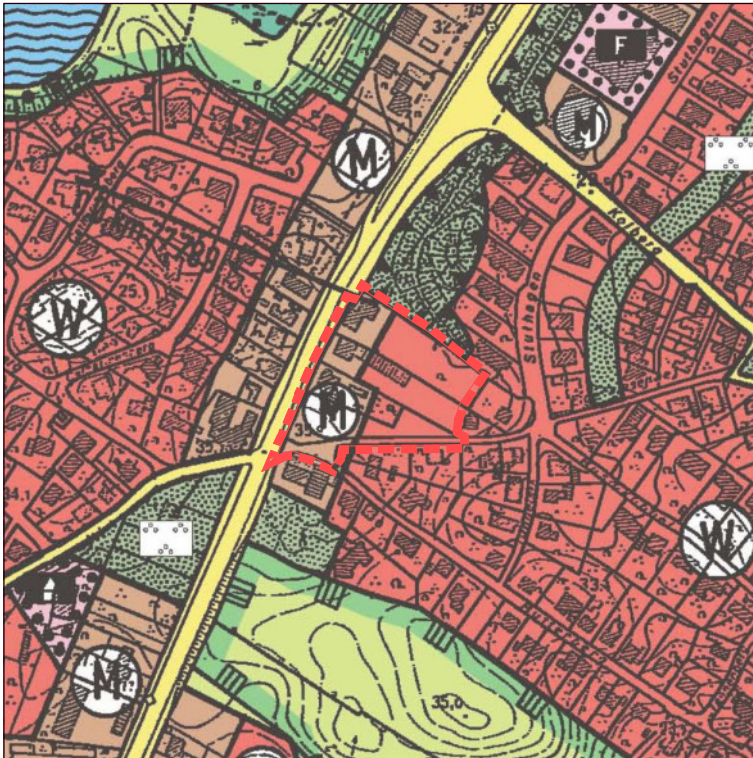
Ausschnitt des aktuell wirksamen Flächennutzungsplanes

1. Berichtigung des Flächennutzungsplanes der Gemeinde Molfsee, Kreis Rendsburg-Eckernförde im Rahmen der Aufstellung der 2. Änderung des Bebauungsplanes Nr. 27