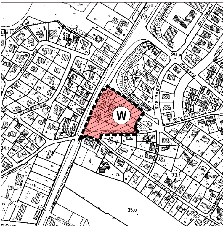
Darstellung der 1. Berichtigung des Flächennutzungsplanes

Überörtliche und örtliche Hauptverkehrsstraßen § 5 Abs. 2 Nr. 3 BauGB